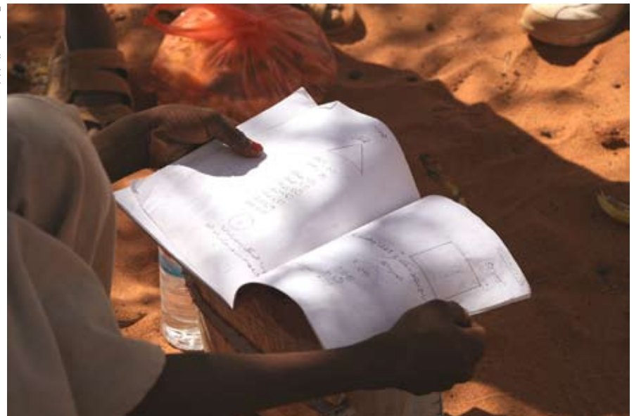
Quaderno di scuola

La domanda di opere sul mondo islamico è lontana dall'essere soddisfatta, nonostante ci si trovi di fronte ad un'offerta numericamente considerevole. Due punti suffragano la nostra tesi. La mancanza strutturale di opere provenienti dall'area arabo-islamica e la scarsità di collane e lavori interamente dedicati che si propongano di indagare l'islam nel suo complesso, evidenziano tendenze in corso e smentiscono la tesi troppo diffusa secondo la quale il mondo islamico appare come un tutt'uno immobile dal Marocco all'Indonesia e dal X-XI secolo ad oggi.